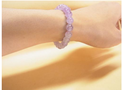
8mm 玉で 23 玉のブレスレット 手首周りのサイズ 16cm